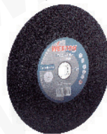
Disco Abrasivo Z-20400 (1 malla) Z-20410 (2 mallas)